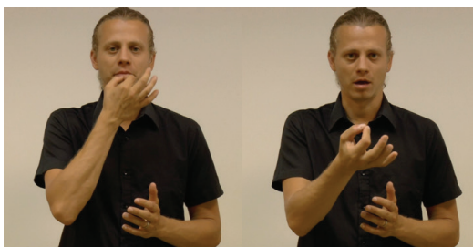
Obr. 2 PTÁT SE (autor: Michal Brhel, Nad'a Hynková Dingová)