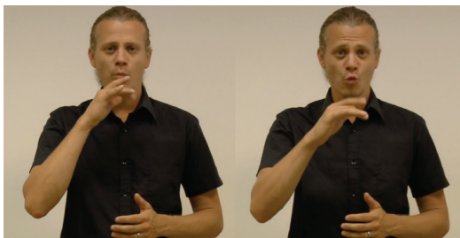
Obr. 1 MLUVIT (autor: Michal Brhel, Nad'a Hynková Dingová)

zvuk, Vaňková 2007) – a to přesto, že se neslyšící Češi ptají, odpovídají, lžou nebo mluví pravdu v jazyce jiném, v českém znakovém jazyce. Tato skutečnost kontrastuje s tím, jak výrazně čeští neslyšící reflektují opozici náš X jejich jazyk (viz výše), resp. – na vyšší rovině zobecnění – opozici „my” X „oni” 14 .